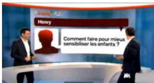
19h45 de M6 29 mai 2013 visualisable sur tablovertleblog.com

Ces chiffres sont tirés d'une enquête réalisée auprès de 1000 enfants âgés de 8 à 12 ans par l'association Santé Environnement France. Ils ont amené le présentateur du journal télévisé de M6 à poser le 29 mai dernier la question « comment faire pour mieux sensibiliser les enfants? »