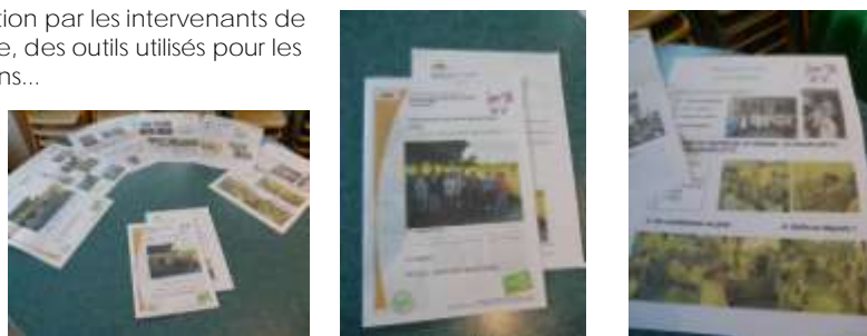
Présentation de livret (CEL Bourg)