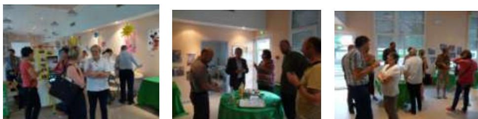
Prolongement des échanges, croisement des regards entre acteurs, mise en perspectives...