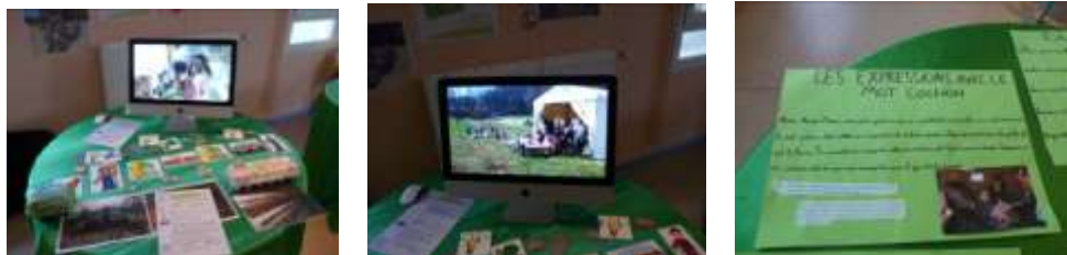
Présentation par les intervenants de leur ferme, des outils utilisés pour les animations...