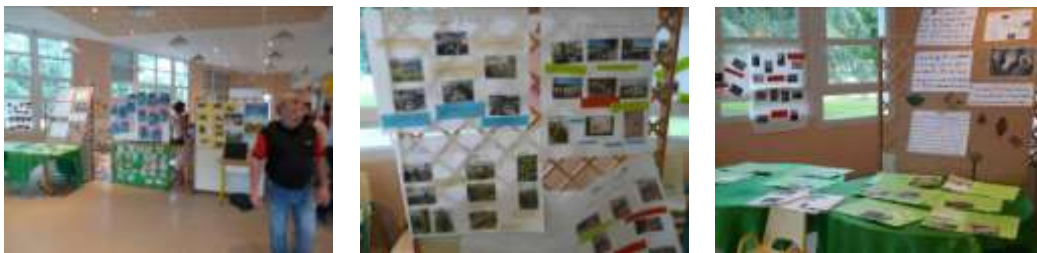
Exposition de travaux conduits par les élèves d'écoles du bassin de Bourg-en-Bresse