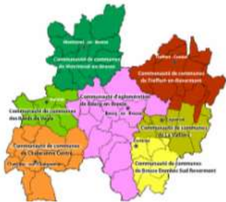
Territoire Cap3B Bassin de Bourg-en-Bresse